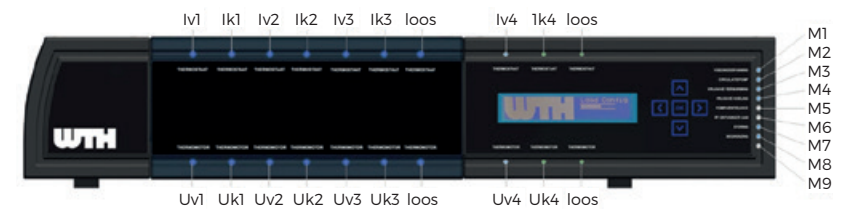
Figuur 2: LED-indicatoren