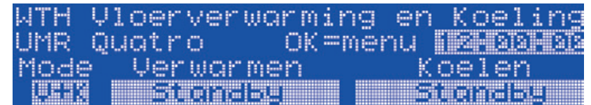
Figuur 5: Basisschermdisplay

Het basisscherm van de display geeft de volgende data weer.