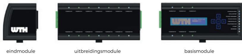
Figuur 1: Modules

De UMR Quatro is opgebouwd uit een basismodule, één of meerdere uitbreidingsmodules en een eindmodule.