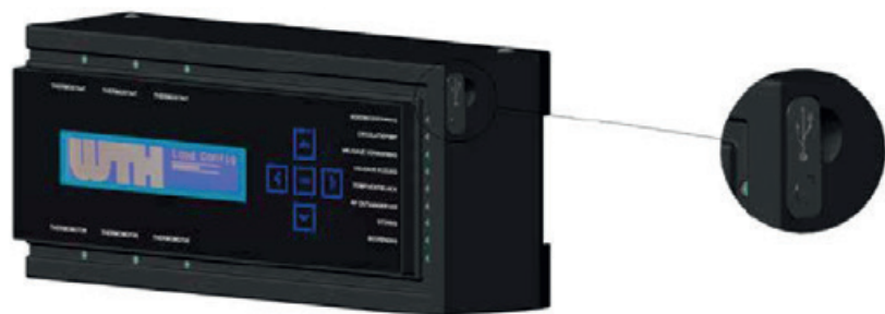
Figuur 3: USB poort

Aan de zijkant van de basismodule bevindt zich een USB poort. Hierop kan een laptop worden aangesloten met behulp van een mini USB kabel. Op deze wijze kan de UMR door WTH worden voorzien van nieuwe(re) programmatuur. De USB-poort mag niet voor andere doeleinden worden gebruikt dan hierboven omschreven. Bij defecten die zijn ontstaan door een onjuist gebruik komt de aanspraak op garantie te vervallen.