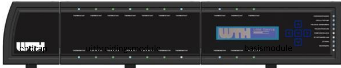
Afbeelding : UMR Quatro met uitbreiding